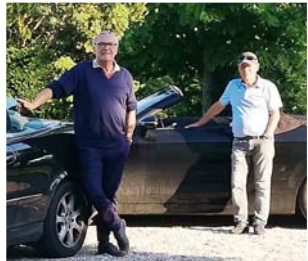
Gemeinsame Hobbys: Cabriofahrten ...