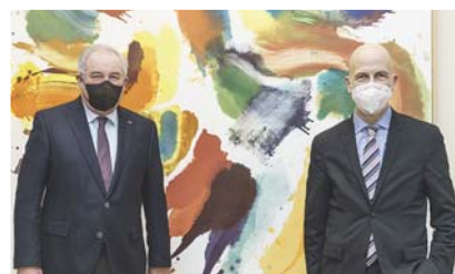
Antrittsbesuch: Landeshauptmann Hermann Schützenhöfer mit Bundesminister Martin Kocher

Seinen Antrittsbesuch absolvierte der neue Bundesminister für Arbeit, Martin Kocher bei Landeshauptmann Hermann Schützenhöfer in der Grazer Burg. Es war der erste Besuch des Ministers beim Landeshauptmann, der mit Anfang des Jahres auch den Vorsitz in der Landeshauptleutekonferenz übernommen hat. Neben der aktuellen Lage am Arbeitsmarkt standen auch die Themen Kurzarbeit und Homeoffice-Gesetz im Zentrum des Gesprächs. „Die Auswirkungen der Corona-Pandemie haben auch die Steiermark und den heimischen Arbeitsmarkt enorm getroffen. Im Dezember waren im Vergleich mit dem Vorjahr beinahe 25 Prozent mehr