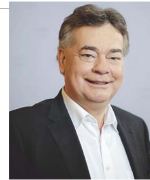
Vizekanzler Werner Kogler

Es war ein ungewöhnliches, aber besinnliches und sehr ruhiges Weihnachten im Kreis meiner engsten Familie. ■■■