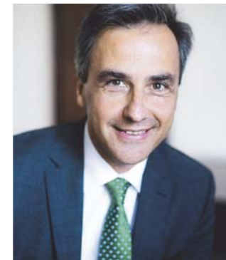
Bürgermeister Siegfried Nagl

Im öffentlichen Verkehr bemüht sich das Verkehrsressort, das Gesamtangebot in allen Regionen zu verbessern. Erfolgsprojekte sind die S-Bahn Steiermark, die Umsetzung der Mikro-ÖV-Strategie oder das Bekenntnis zur Mitfinanzierung des Straßenbahnausbaus in Graz. Außerdem wurde der RegioBus-Verkehr in zahlreichen Regionen massiv ausgebaut. Ein Schwerpunkt liegt am Ausbau des Alltagsradverkehrs. Und schließlich gilt es, das rund 5.000 Kilometer umfassende steirische Straßennetz zu erhalten sowie neue Projekte zu realisieren. Dies sorgt für freie und sichere Fahrt, wertet den Wirtschaftsstandort auf und sichert Arbeitsplätze. ■■■