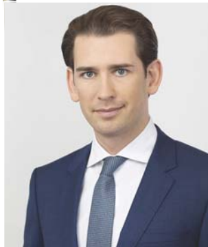
Bundeskanzler Sebastian Kurz