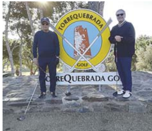
... und das Golfspiel