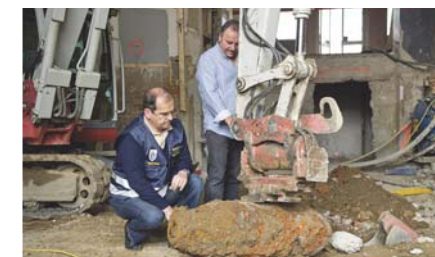
Vorbereitung auf die Blindgängersprengung