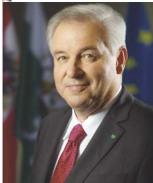
Landeshauptmann Hermann Schützenhöfer