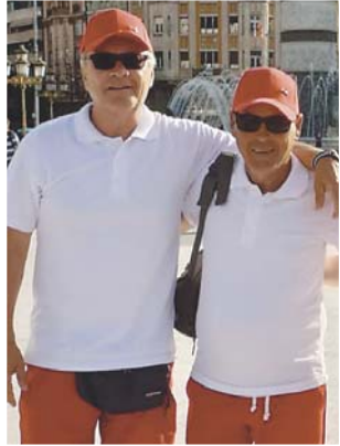
Fußball-Länderspiel in Skopje, 2019

Eine tiefe Freundschaft verbindet seit 40 Jahren Klaus Eichberger und Günther Stix. Mit den Ehefrauen gab es viele gemeinsame Urlaube, wöchentliche Kartenrunden aber auch Tennismatches und Golfpartien. Gemeinsam haben die beiden Freunde viele Höhen und auch Tiefen durchlebt und sich gegenseitig durch Krisen geholfen.