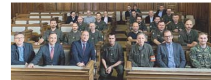
Die wichtigsten Player (neben dem ÖRK) bei den Massentests auf einen Blick: Die Stadtspitze mit dem behördlichen Führungsstab sowie Angehörigen des Bundesheeres.