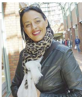
Kritisch betrachtet von Daniela Pertzl

Dass sich diese ebenso rücksichtslos wie mit nicht vorhandenen Manieren ausgestatteten Zeitgenossen auch nicht um die simpelsten Pandemie-Regeln wie Abstand halten kümmerten, vervollständigt das Bild.