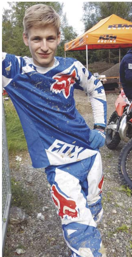
Auch der Motocross-Sport zählte zu Philipps Leidenschaften