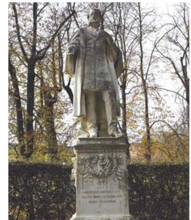
Beide verbergen sich jetzt hinter grauen Holzmänteln