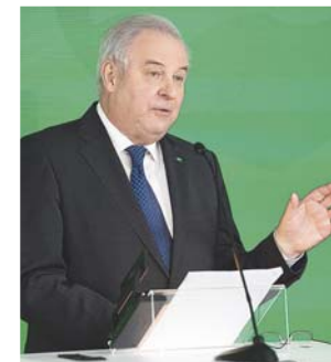
Landeshauptmann Hermann Schützenhöfer gab in seiner Rede die Parole aus: „Halten wir zusammen und gehen wir zuversichtlich ins Jahr.“